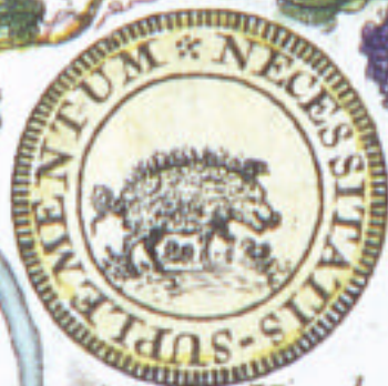
Pour la Viande