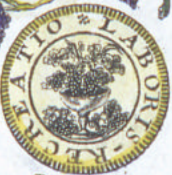
Pour le Vin