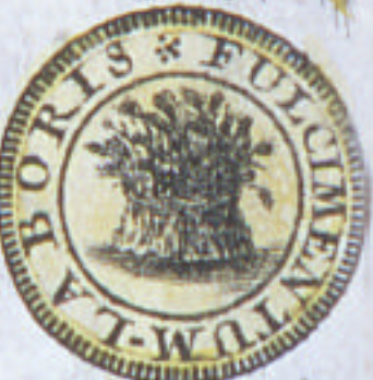
Pour le Pain