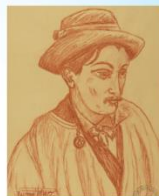
Portrait de Gaston Couté en costume régional, 1910 musée des Beaux-Arts de Paris