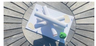
Maquette réalisée par des élèves du collège Jean Rostand CVO